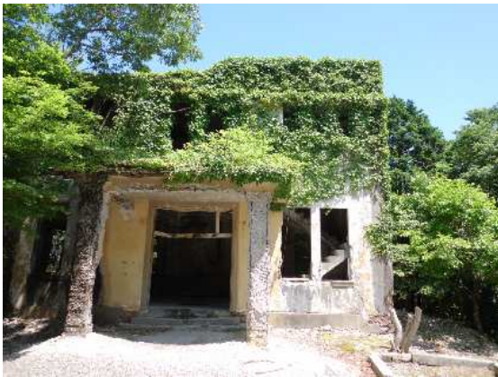
ケーブル愛宕駅跡