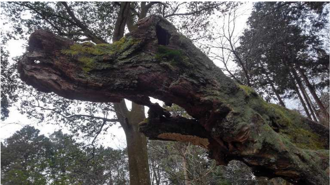
ワニの頭？ 神社境内にて