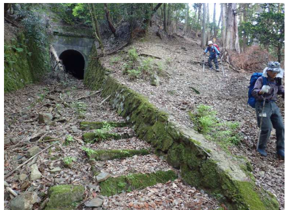
ケーブル愛宕駅跡