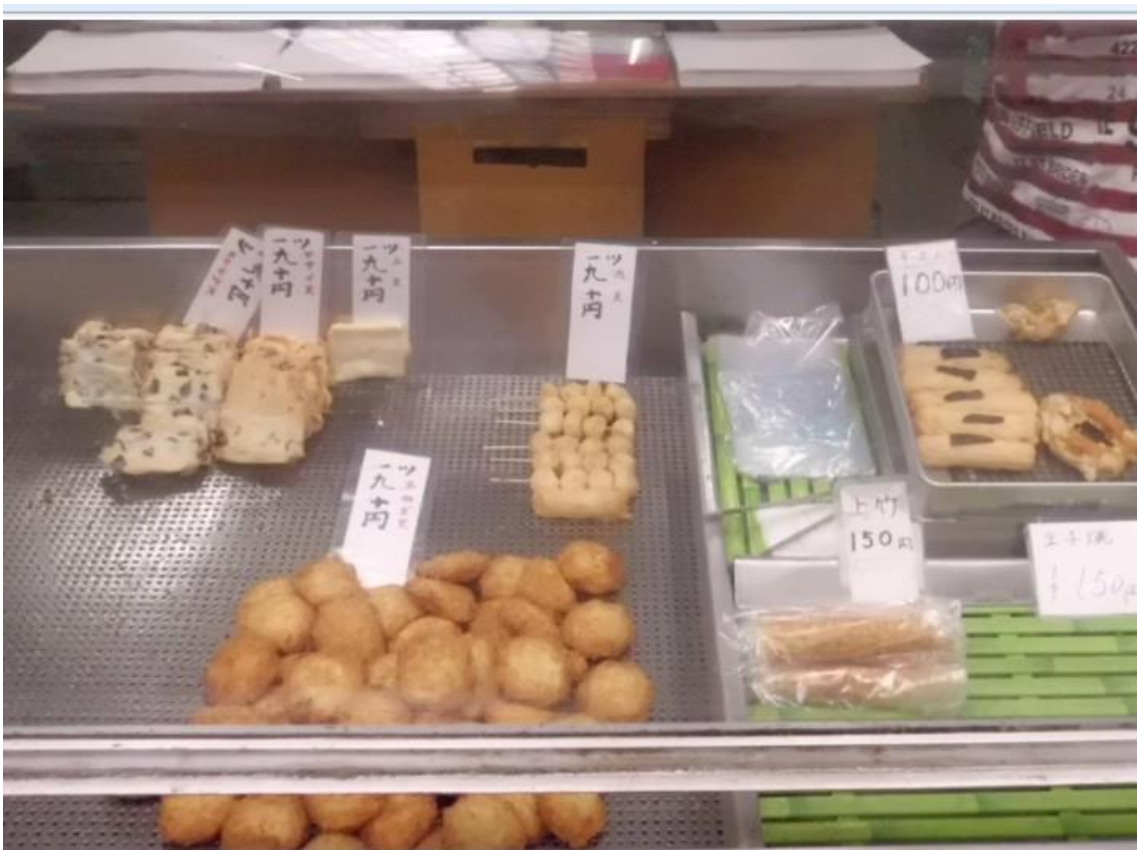
この大貴蒲鉾店の玉葱のフライを食べるために須磨アルプスを歩くようなもの。魚のすり身に玉葱のあられ切り。淡路産の玉葱だけだと柔らかくなり過ぎるので他産地と混合。