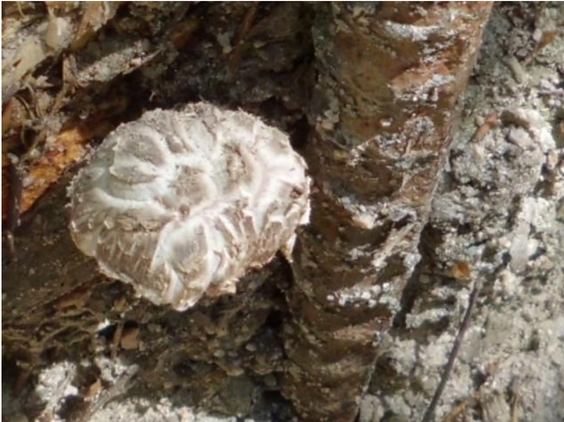
東山手前の階段に冬菇シイタケが