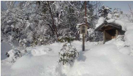
賽の河原 ここから不動尊まで藪漕ぎ