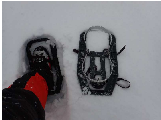
バージョンアップのスーパーカンジキ