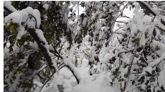
雪を払いながらの藪漕ぎ