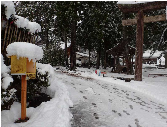
長谷寺 公衆トイレ有り