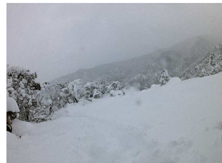
引き返し地点のラッセル跡 カンジキを履いても腰までの積雪