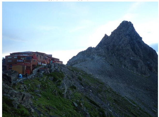
朝の槍ヶ岳（山頂でご来光を見る人達）