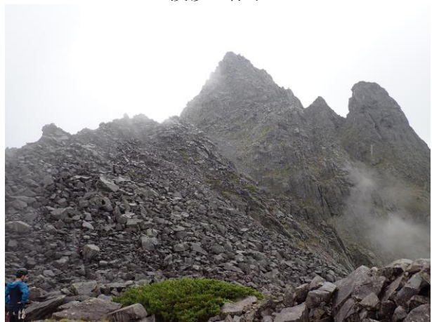
槍ヶ岳の背中を望む