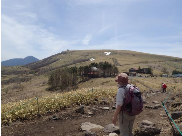
車山を望む。山頂へは右にぐるっと巻いた道