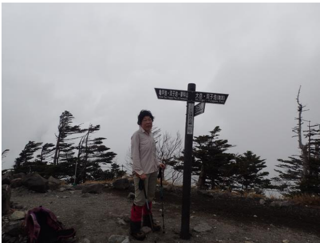
頂上には雪がない。展望なく風が冷たい