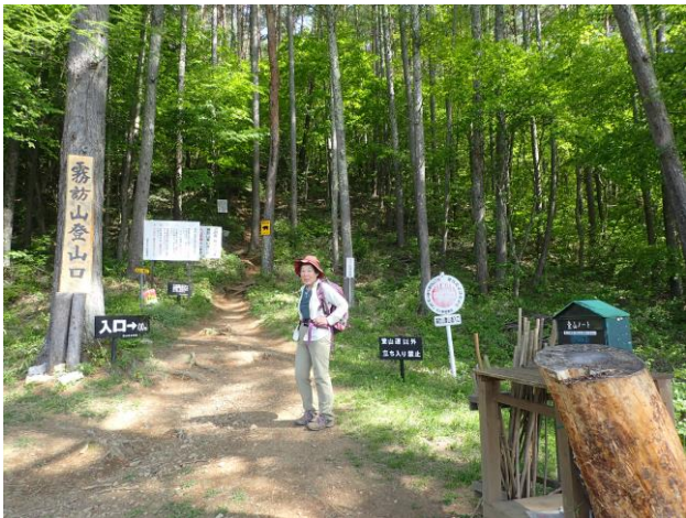
登山口には標識がずらり