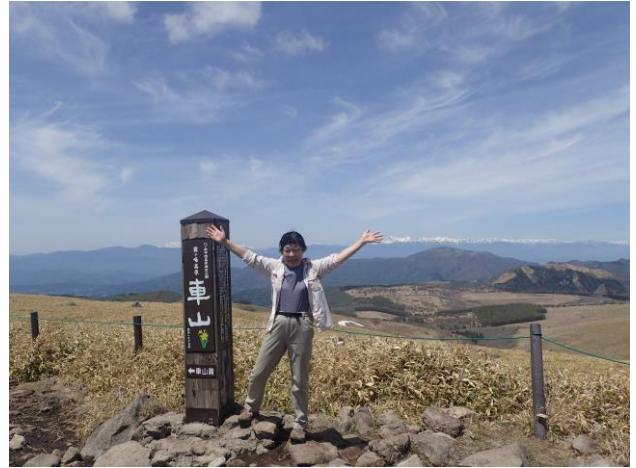
百名山達成！！ バックには北アルプス