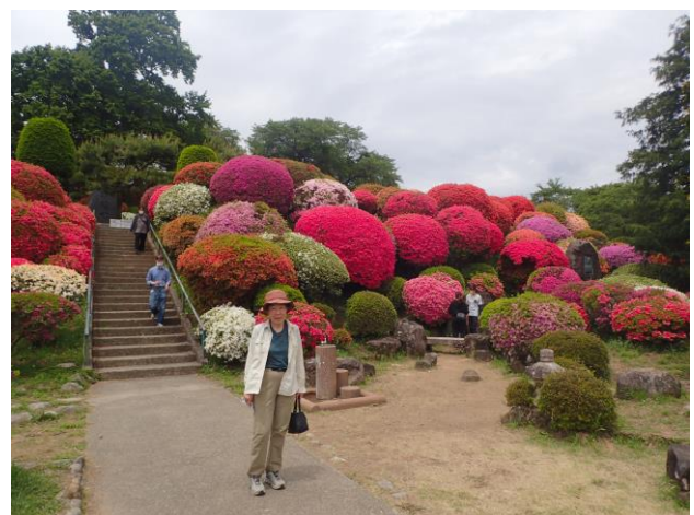
鶴峯公園のつつじ祭り。30種3万株のツツジ