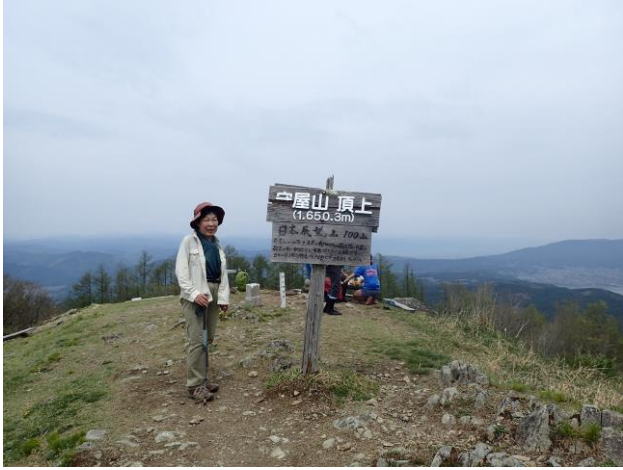
守屋山山頂。眺望よし