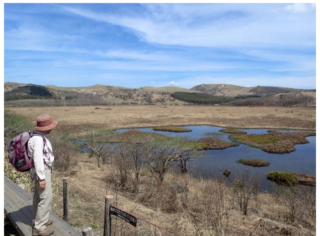
八島湿原、右奥が車山。1周回った