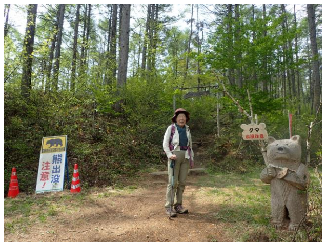
かわいいクマのお出迎え