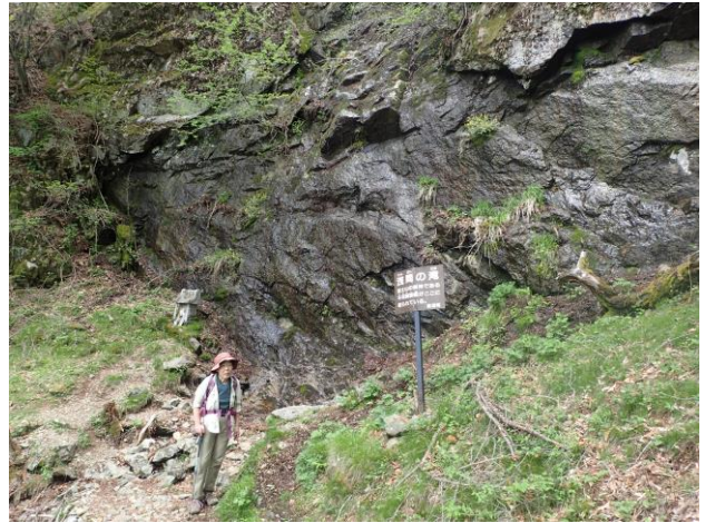
浅間の滝。水はちよろちよろ