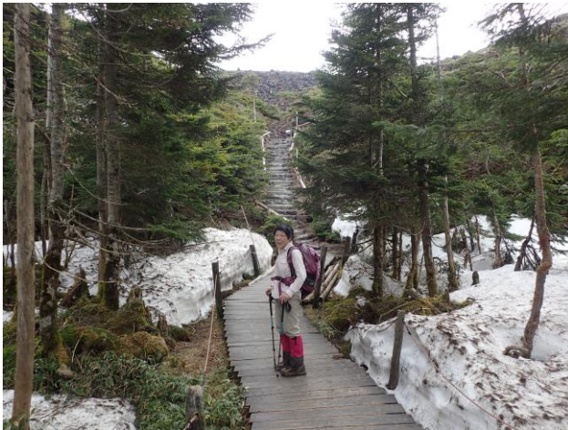
日本庭園風の坪庭散策路