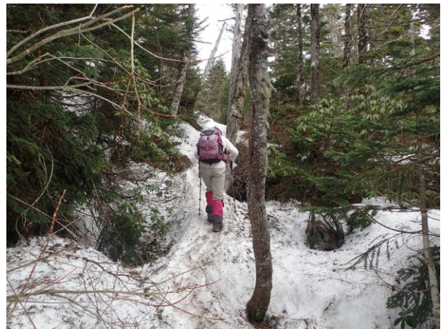
北横岳山頂近く。雪がどんどんふえる