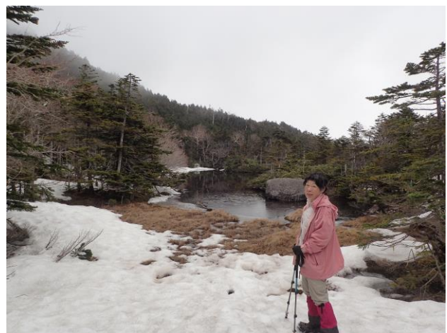
セツ池。景色よいが、先へは行けない