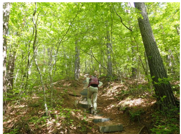
新緑のまぶしい道