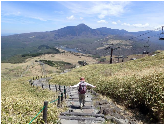
白樺湖を見ながら駆け降りる