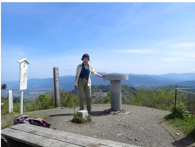
霧訪山山頂も 360 度の眺望