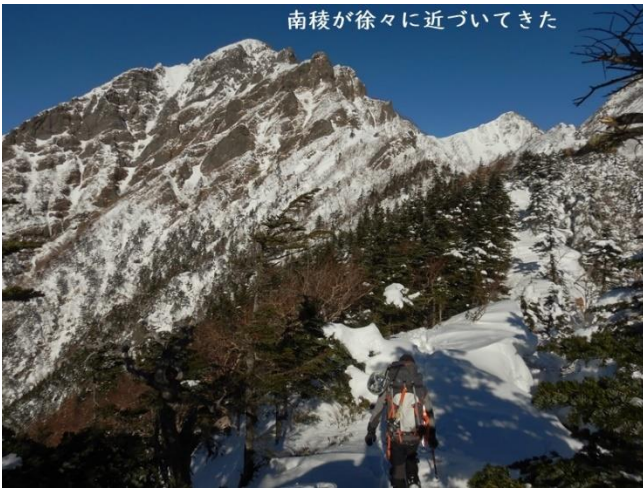
南稜が徐々に近づいてきた