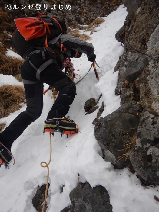
P3ルンゼ登りはじめ