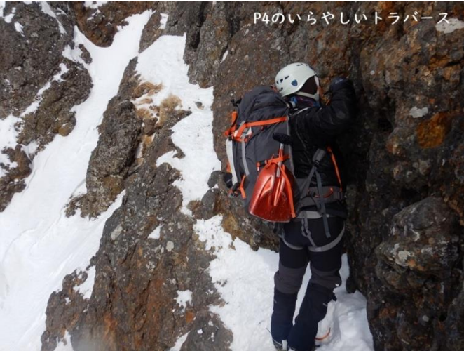
P4のいらやしいトラバース