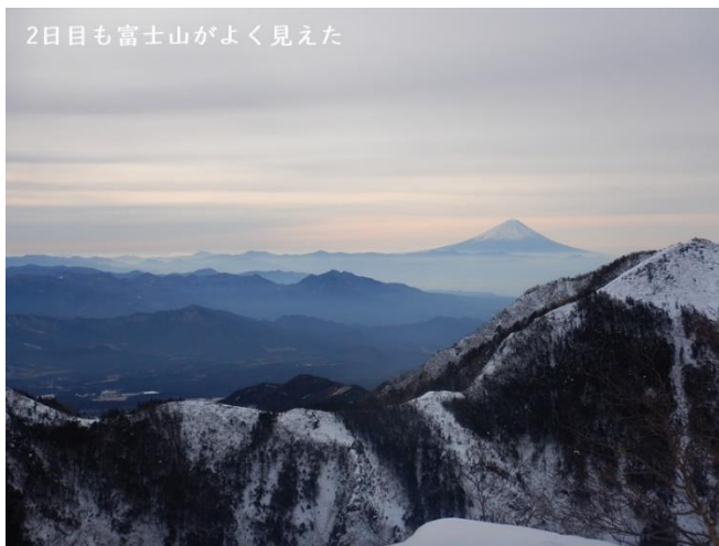
2日目も富士山がよく見えた