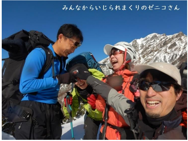
みんなからいじられまくりのゼニコさん