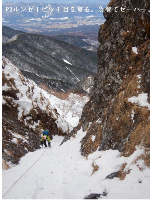
P3ルンゼ1ピッチ目を登る。急登でゼーハー。