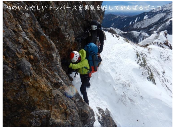
P4のいらやしいトラバースを勇気をだしてがんばるゼニコ