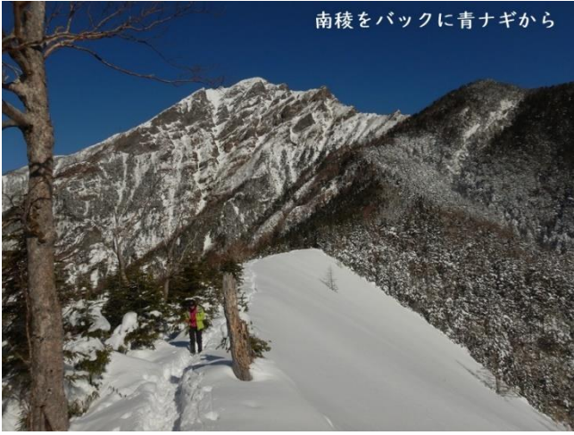
南稜をバックに青ナギから