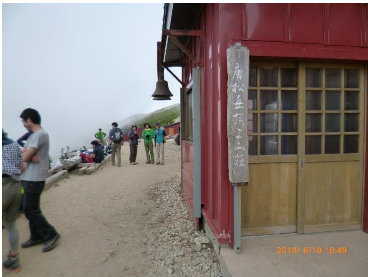
10 : 49 唐松山荘脇に荷物をデポし 唐松岳山頂に向かいます。