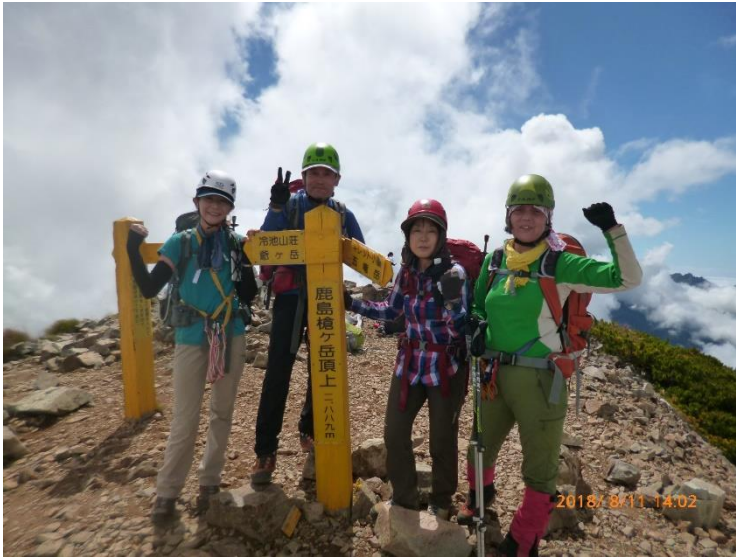
14 : 02 鹿島槍ヶ岳南峰