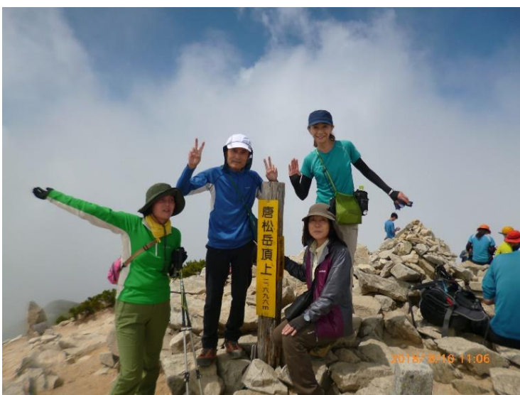
11 : 06 以前から念願の唐松岳に登 頂です。 雲が湧いて眺望は今ひとつ。