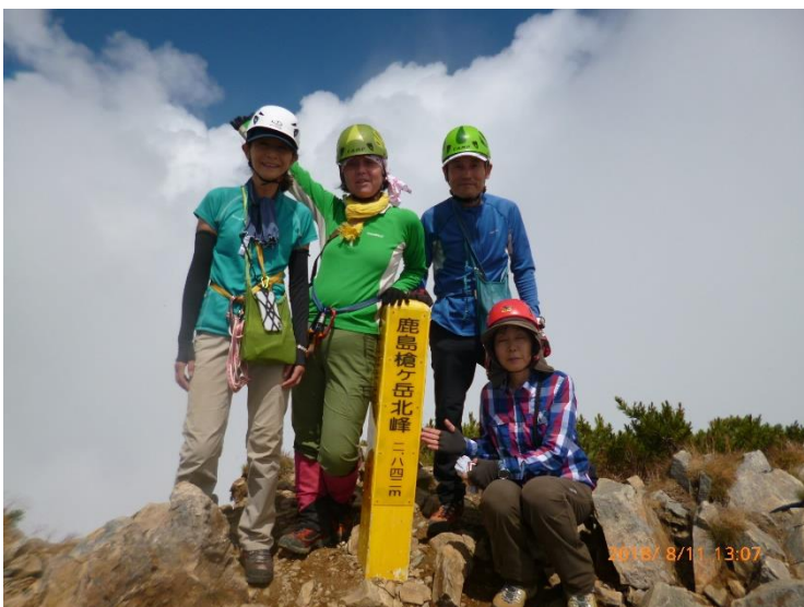
13 : 07 鹿島槍ヶ岳北峰