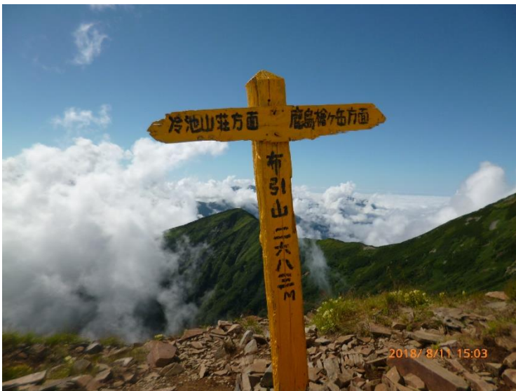
15 : 03 布引岳