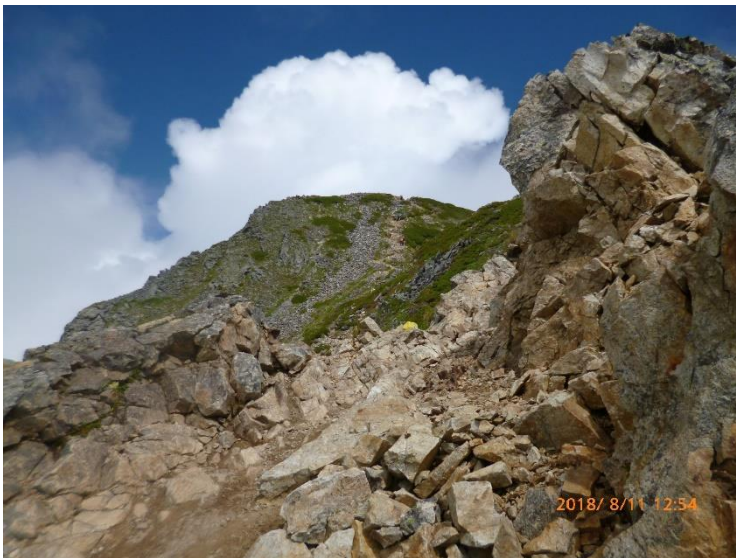
12 : 54 鹿島槍ヶ岳北峰分岐から 歩いたルートを振り返る。