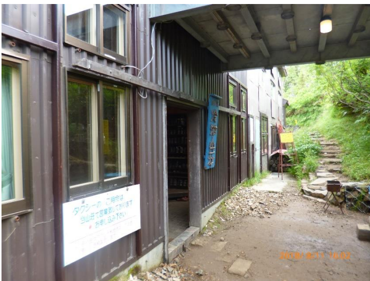
16 : 01 冷池山荘に到着です。 長時間お疲れ様でした！！ この後、冷えたビールと ノンアルコールで祝杯を挙げました。 今夜はこちらでお世話になります。