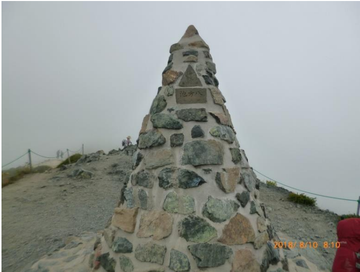
08 : 10 八方池第三ケルン