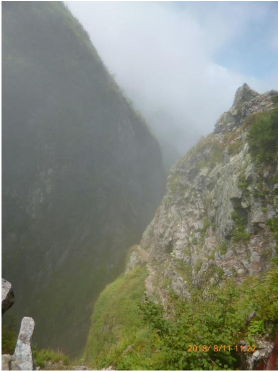
11 : 22 キレットの核心部