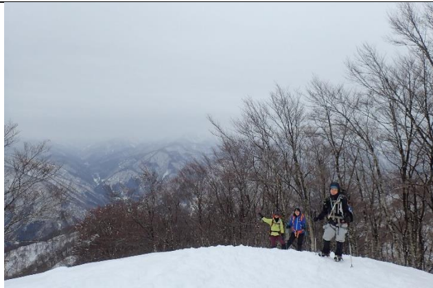
シャクナゲ平に到着