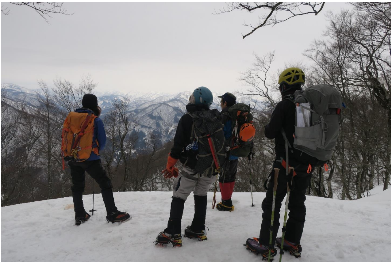
シャクナゲ平から経ヶ岳を望む。残念ながら白山までは見えませんでした。何とか天気もちました。