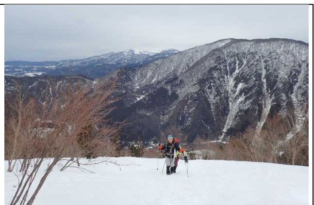
高度を上げて経ヶ岳が見えてきました。