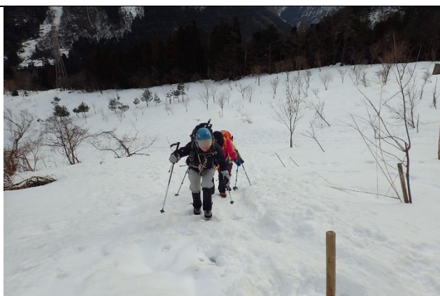
登山口から急な登りがつづく

引き続きクライミング教室でもお世話になるかと思います、どうぞよろしくお願いします。